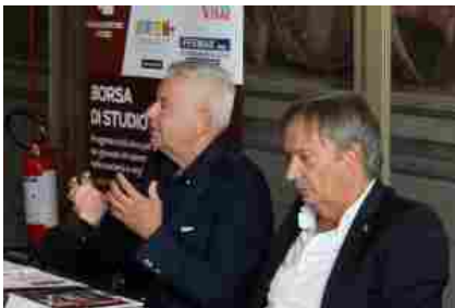
La Despar 4 Torri scende in campo ancora una

volta nel sociale, tra i giovani, calandosi perfettamente nel solco della sua storia iniziata 75 anni fa. È stato presentato alla stampa e alla cittadinanza, nella mattinata di lunedì 23 ottobre alla Sala dell'Arengo di Palazzo Municipale, il nuovo progetto promosso dalla società granata, e sviluppato in collaborazione con CEMA NEXT. "Borsa di studio 4T" è il nome dell'iniziativa che ha visto il coinvolgimento di importanti imprenditori ferraresi e che andrà in sostegno,